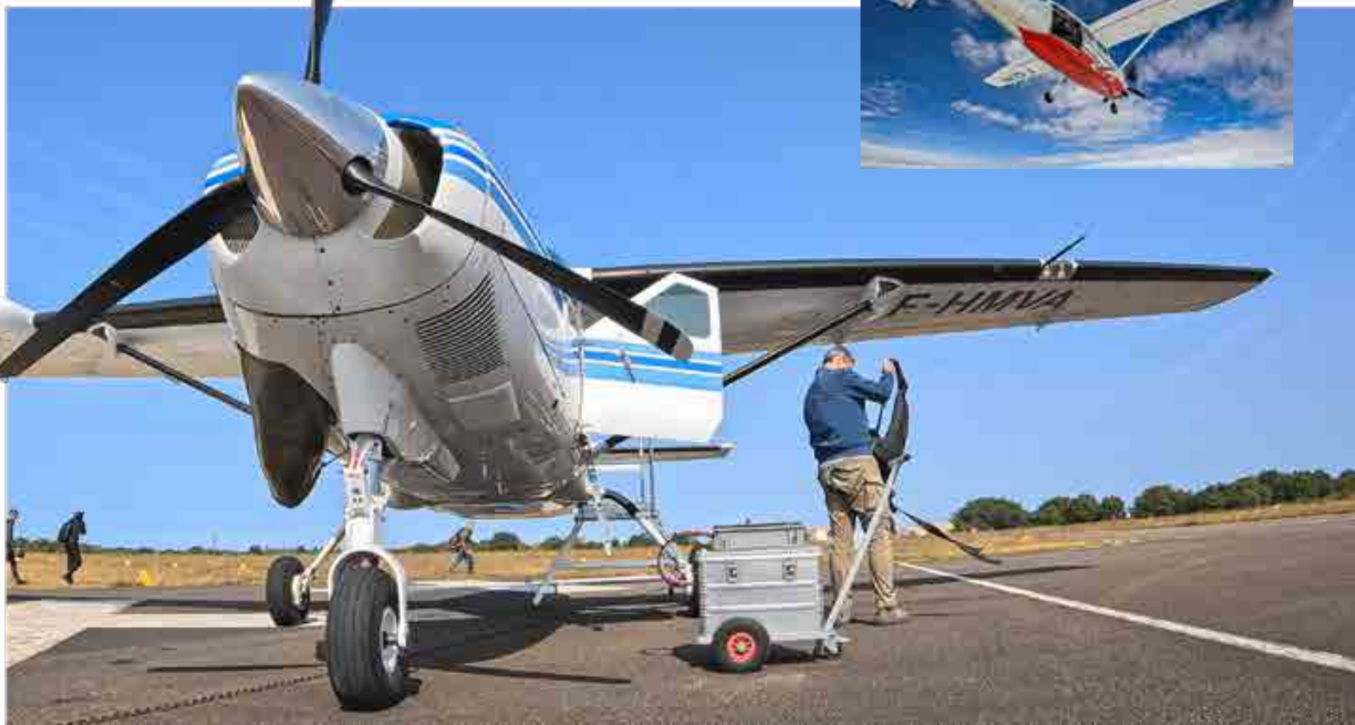
Cessna 208 Caravan