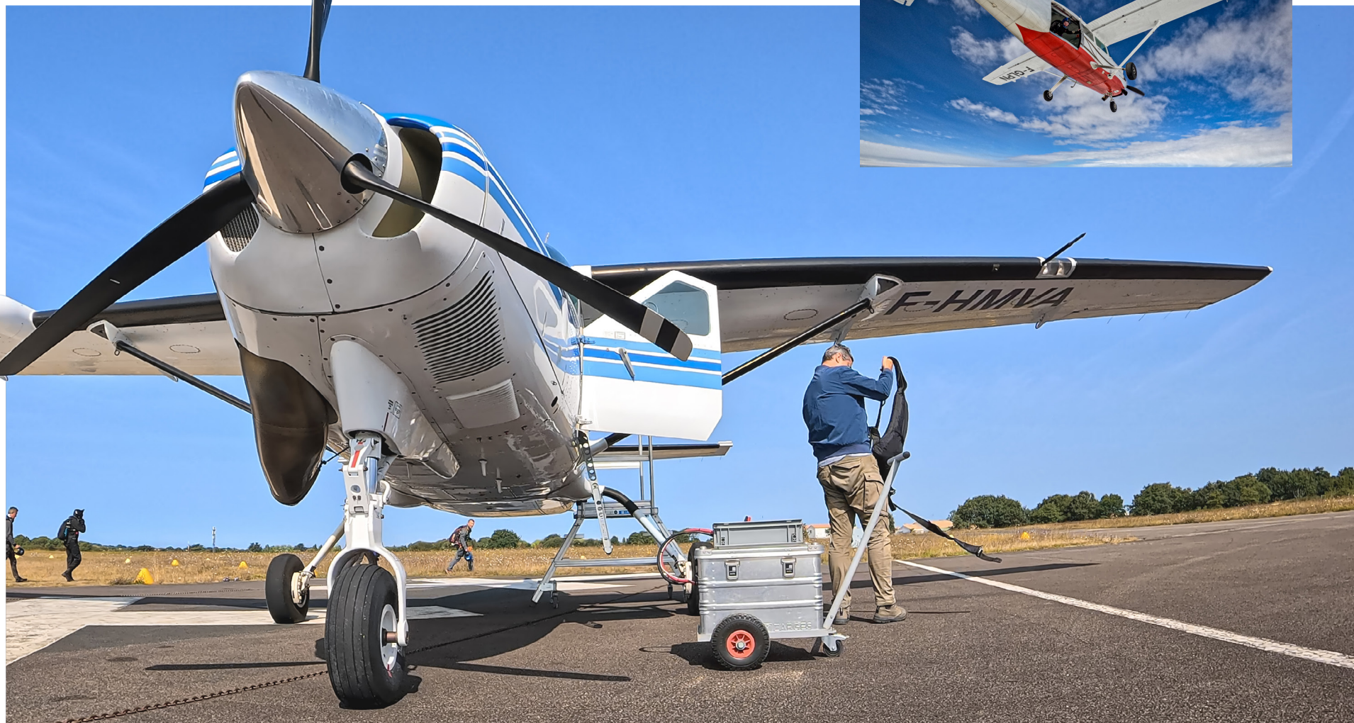
Cessna 208 Caravan